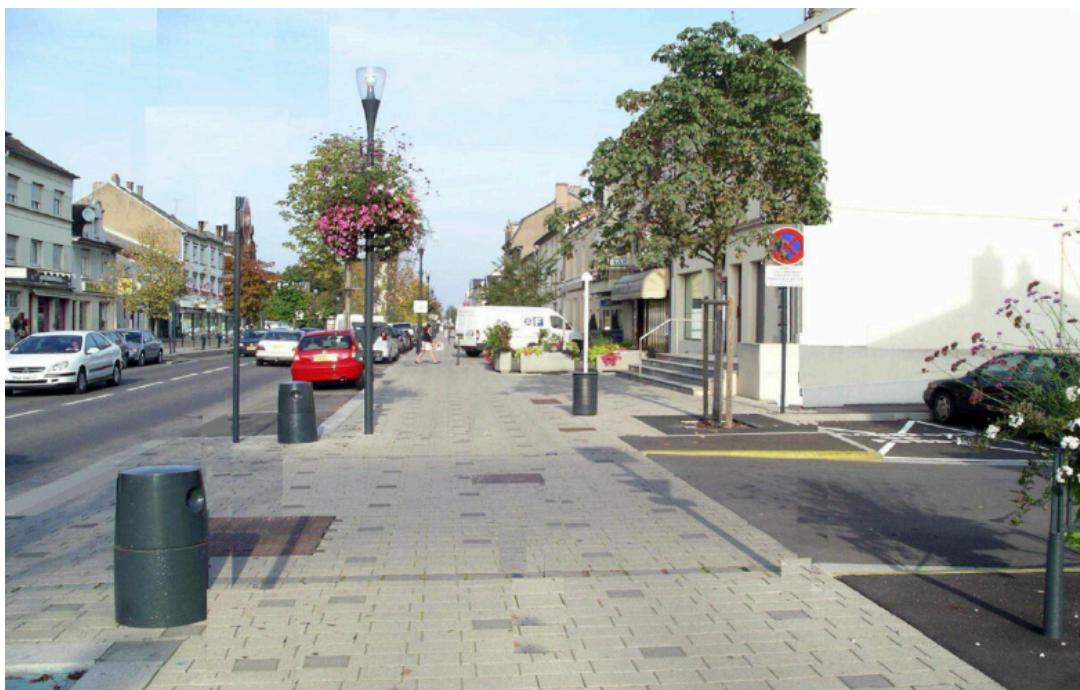
Figure 4: Exemple de trottoir traversant à Sainte Luce.

Dans l'attente d'une réponse de la mairie à ce courrier, je vous prie, au nom de l'APROVEL, de recevoir nos salutations distinguées.